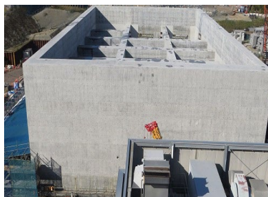
常設代替高圧電源装置 置場設置工事の状況