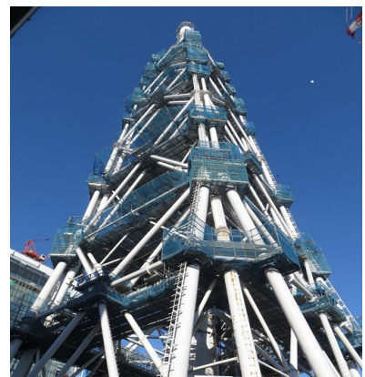
主排気筒耐震補強工事 の状況