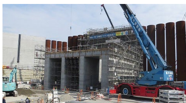
防潮堤設置工事 の状況